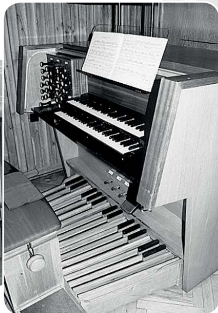
fol: firma DGR-PROJEKT

manuały i pedały) o mechanicznej trakturze gry i wiatrownicach zasuwowych. Instrument ten, oznaczony jako op. 3486, stanął w nowo wybudowanej Miejskiej Sali Koncertowej, noszącej obecnie nazwę Sali Koncertowej im. Ireny Dubiskiej.