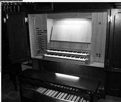
fol. firma ZYCH